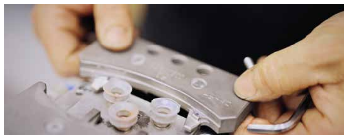
Kit cambio pastiglia

Scarica i nostri cataloghi scannerizzando il QR CODE o utilizzando il seguente link: www.aseo.srl/cataloghi/