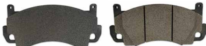
Elemento non lavorato

Nelle zone di lavoro della mola vi sono presenti un sistema di cappe in modo da consentire l'aspirazione delle polveri.